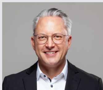
Kernstadt Aalen 1