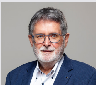
Kernstadt Aalen 2

48 Jahre, verheiratet, 1 Tochter, CDU-Fraktionvorsitzender, ehrenamtlicher Stellvertreter des OB, stellvertretender Vorsitzender Aufsichtsrat Stadtwerke, Mitglied Aalener Sportallianz, kunterbunt e.V. Aalener Jazzfest, Turngau Ostwürttemberg.