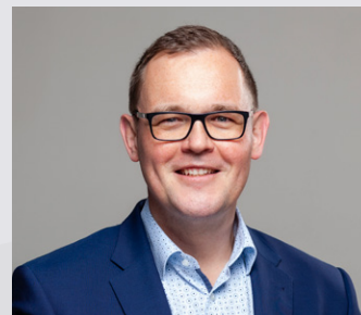
Kernstadt Aalen 7

51 Jahre, alleinerziehend, 2 Kinder, seit 10 Jahren Elternbeirat – davon 8 Jahre am Schubart Gymnasium, seit 8 Jahren ständiges Mitglied im Vorstand des TC Aalen e.V. – davon 2 Jahre als 2. Vorsitzende.