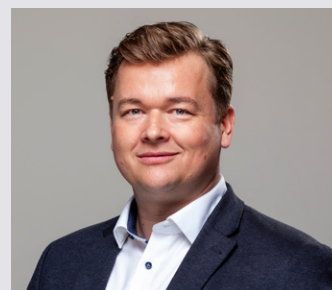
Kernstadt Aalen 3

69 Jahre, verheiratet, Stadtrat, stv. Fraktionsvorsitzender, Mitglied TSG Hofherrnweiler-Unterrombach, Aufsichtsrat VfR Aalen, KSV 05 Aalen, DAV, St. Georgs Pfadfinder, Feuerwehr Förderverein, Aufwind e.V., Neue Siedlergemeinschaft Pelzwasen-Zebert.