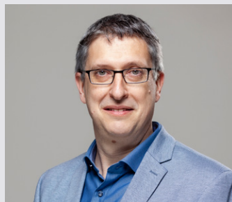
Kernstadt Aalen 5

Ich leitete 31 Jahre die Bäckerei Walter und habe Industriekauffrau gelernt, bin 69 Jahre, verheiratet und habe 2 Kinder. Ich bringe mich aktiv ein im CDU-Ortsverband Aalen sowie als Kassiererin und Mitglied des KSV Aalen 05.