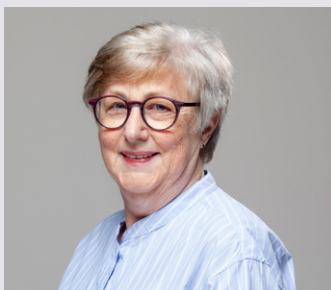
Kernstadt Aalen 4

41 Jahre, verheiratet, 3 Kinder, Maler- und Kfz-Lackierermeister, Stadtrat, im Vorstand CDU-Stadtverband und Ortsverbandsvorsitzender der CDU Aalen, Tennisabteilung TSG Hofherrnweiler-Unterrombach.