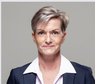
Kernstadt Aalen 6

49 Jahre, verheiratet, 2 Kinder, seit 2020 Feuerwehrkommandant der Abteilung Aalen, Mitglied DRK, Feuerwehrverein und Sportallianz. Ich stehe für Ehrenamt und bürgerschaftliches Engagement.